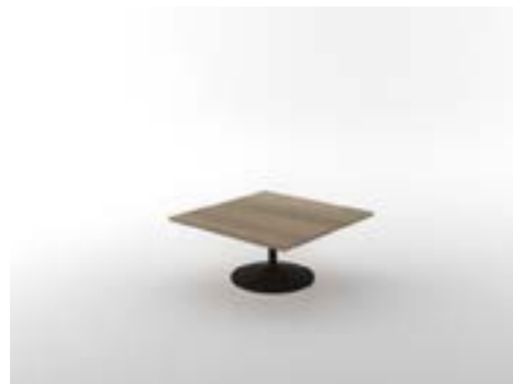
19 LA—QUE Quercia/Oak tree