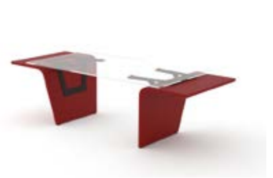
12 LA—RAL Personalizzato/Personalized