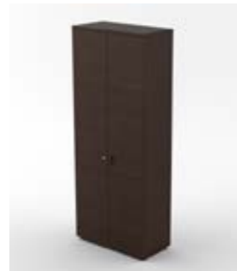
23 LA—LRS Rovere scuro/Dark oak