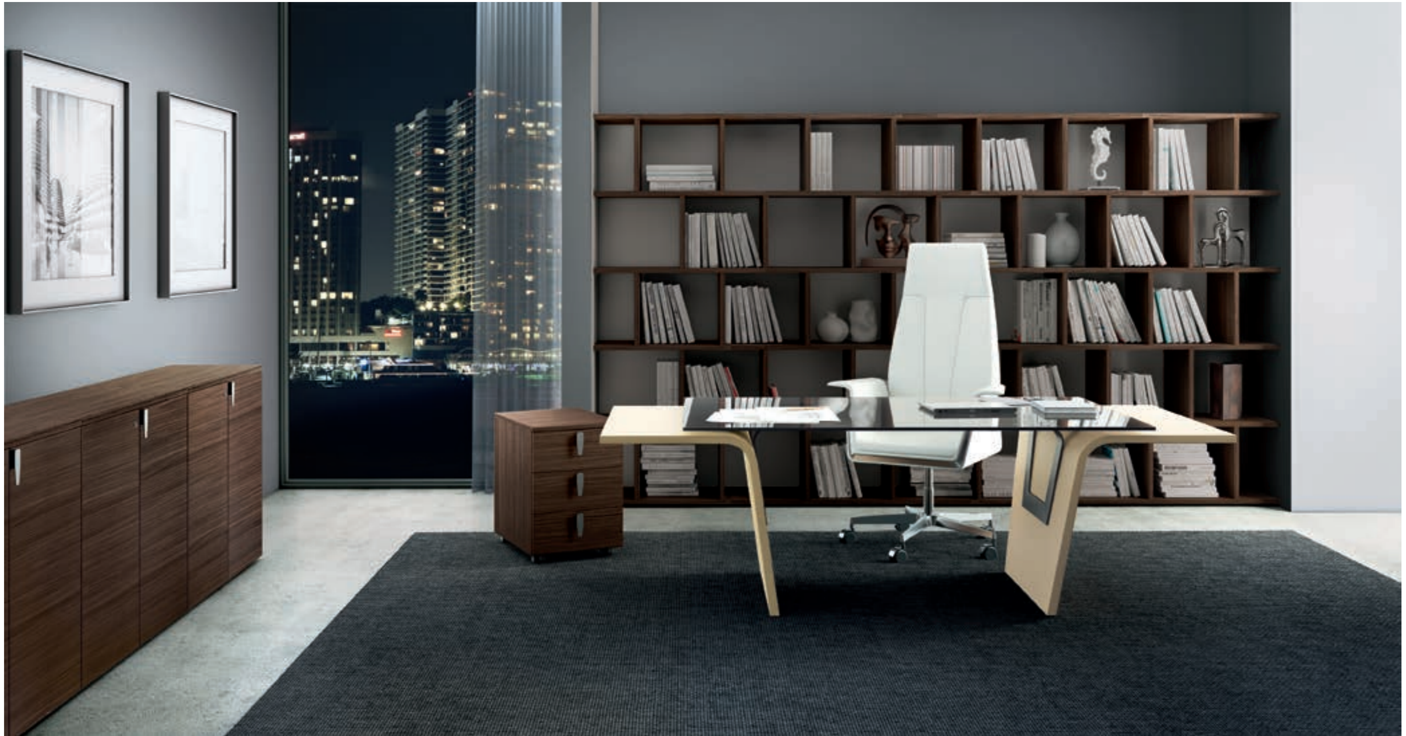
Vetro laccato nero con gamba laccata ral 1019 Black lacquered glass with lacquered leg ral 1019