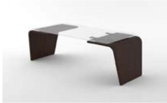
07 LA—LRS Rovere scuro/Dark oak