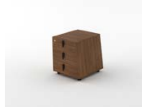
15 LA—LNO Noce naturale/Natural walnut