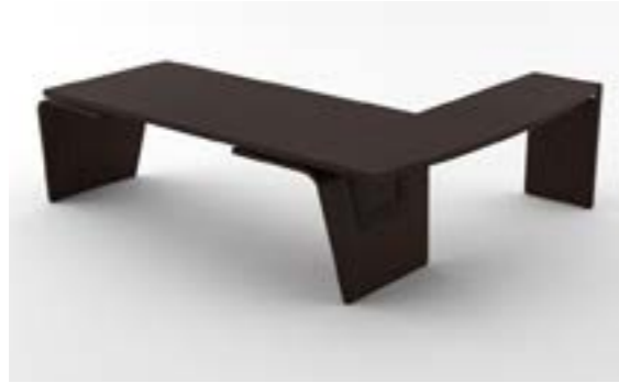
03 LA—LRS Rovere scuro/Dark oak