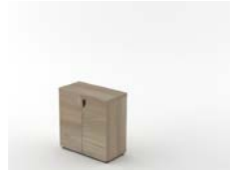
21 LA—QUE Quercia/Oak tree