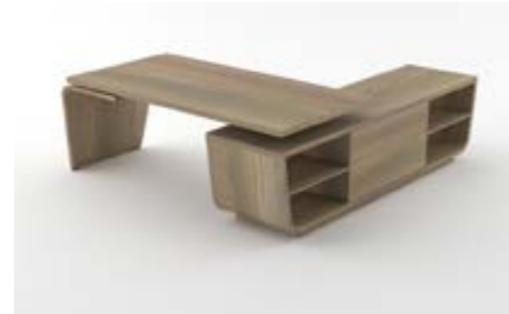
13 LA—QUE Quercia/Oak tree