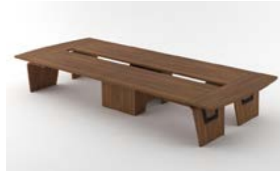
18 LA—LNO Noce naturale/Natural walnut