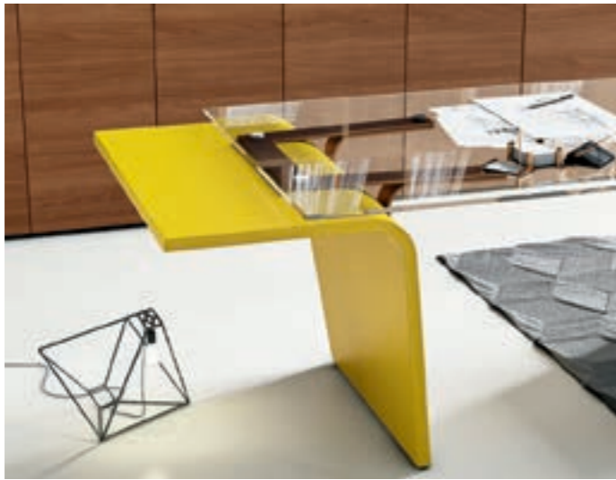
Vetro extrachiaro con gamba laccata con colore personalizzato Extra clear glass with lacquered leg with personalized colour