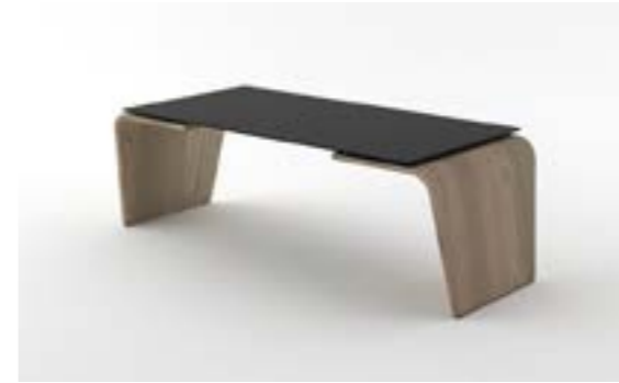
09 LA—QUE Quercia/Oak tree