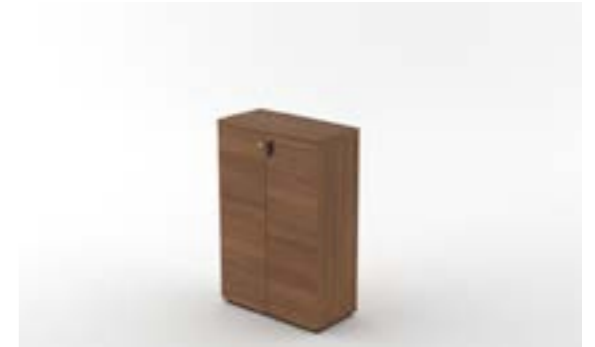
22 LA—LNO Noce naturale/Natural walnut