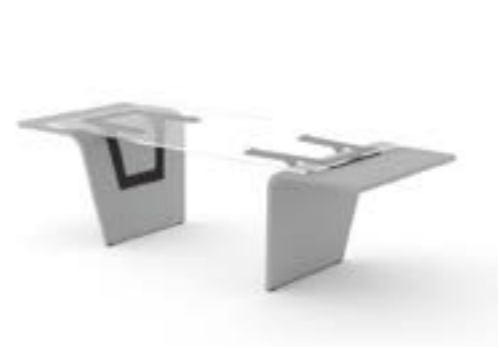
11 LA—RAL 7037