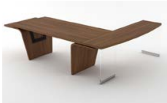
05 LA—LNO Noce naturale/Natural walnut