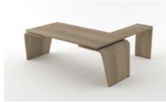
02 LA—QUE Quercia/Oak tree