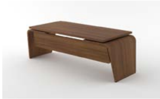
01 LA—LNO Noce naturale/Natural walnut