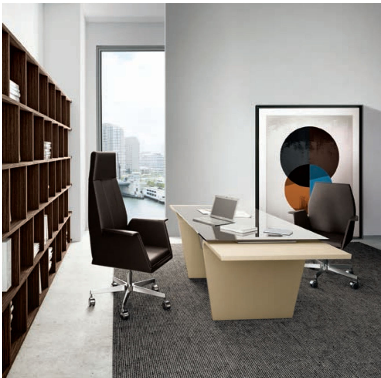
Vetro laccato nero con gamba laccata RAL 1019 Black lacquered glass with lacquered leg RAL 1019