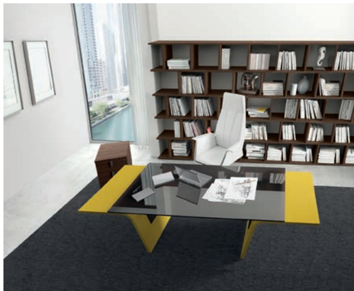
Vetro laccato nero con gamba laccata con colore personalizzato Black lacquered glass with lacquered leg with personalized colour