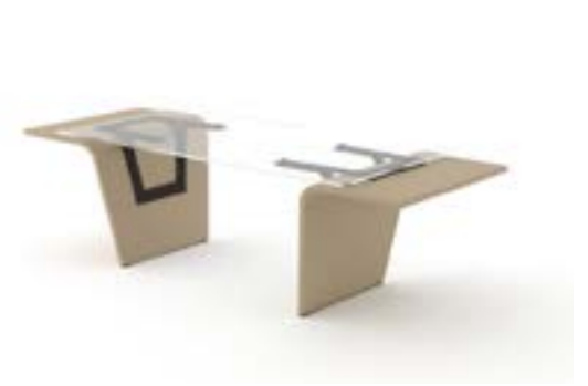
10 LA—RAL 1019