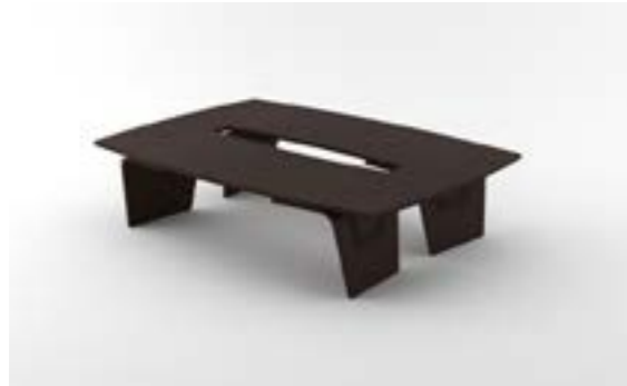
17 LA—LRS Rovere scuro/Dark oak