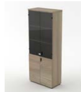
24 LA—QUE Quercia/Oak tree