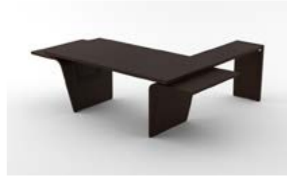
04 LA—LRS Rovere scuro/Dark oak