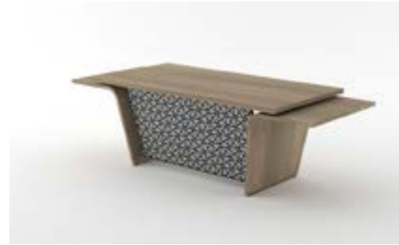
06 LA—QUE Quercia/Oak tree