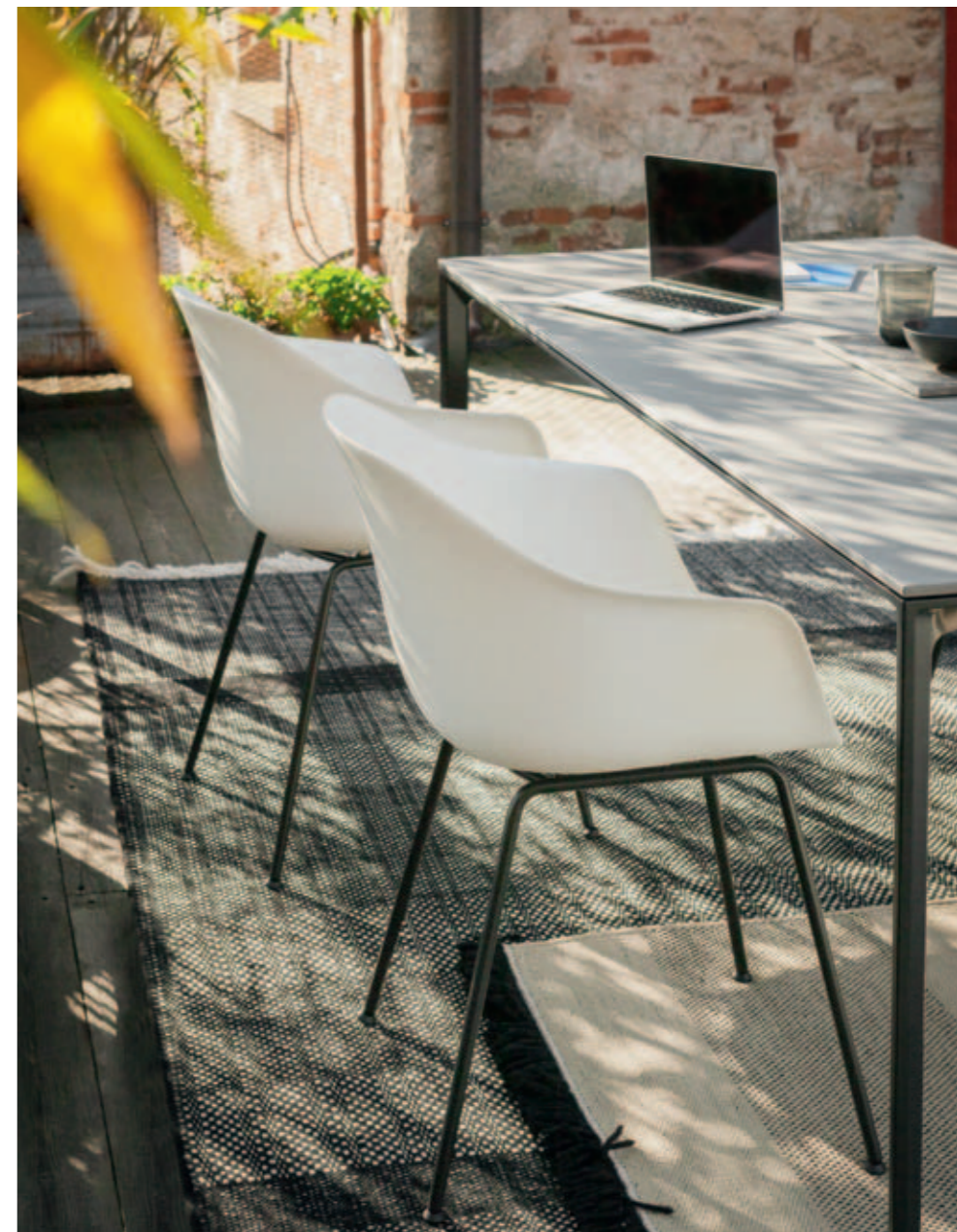
SEELA AC chair, ADD T table