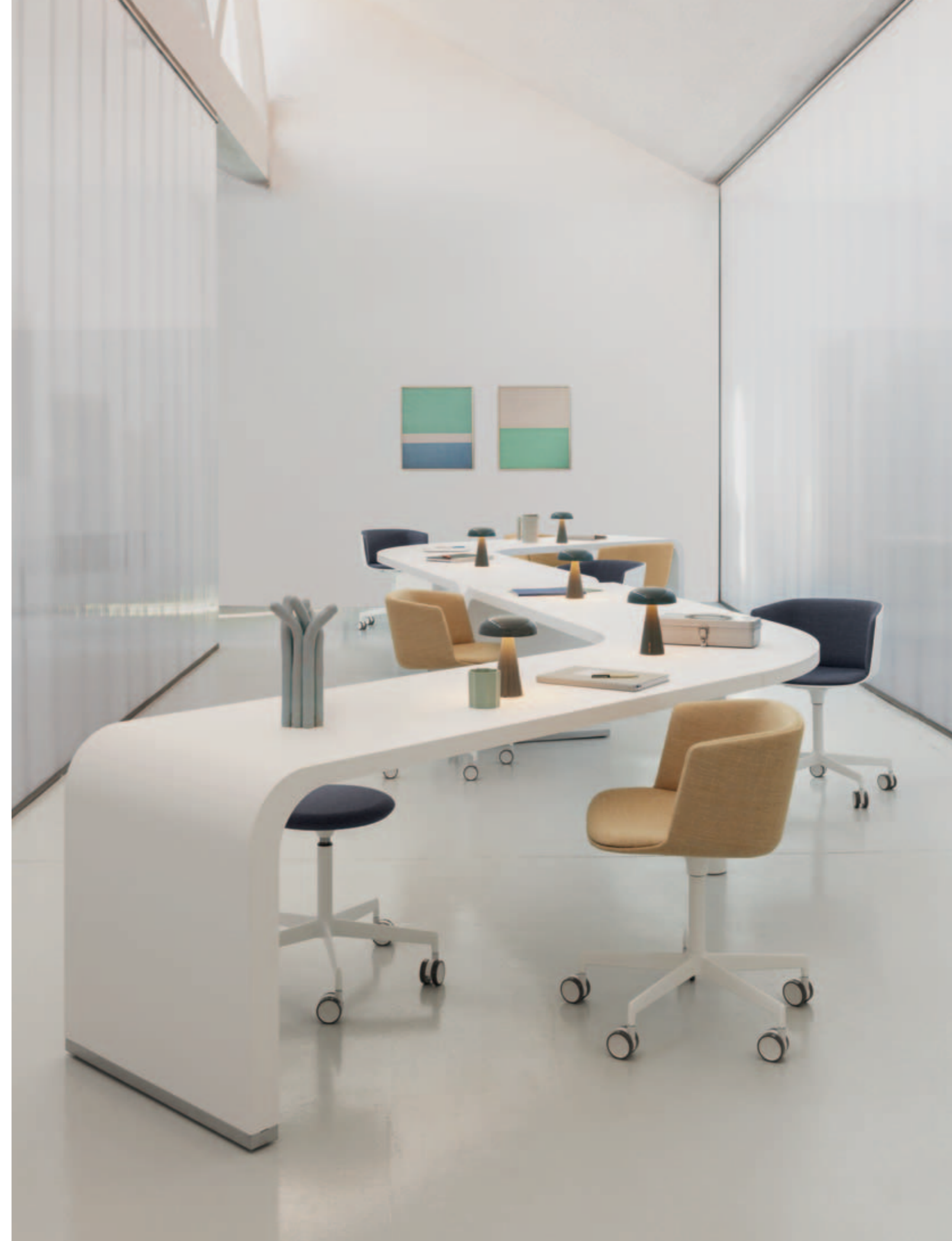
CUT chair, LAB stool, BRUNCH table