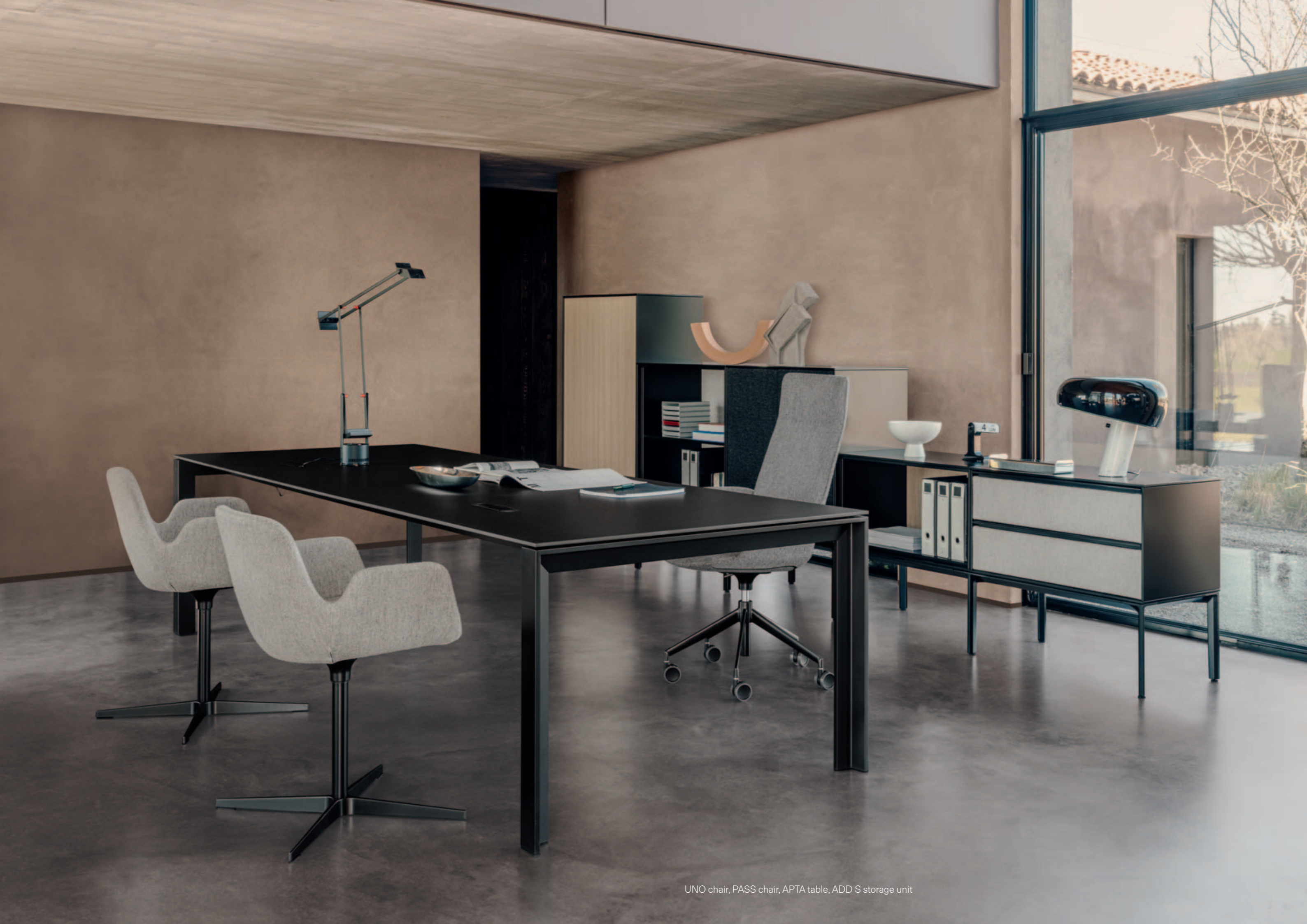
UNO chair, PASS chair, APTA table, ADD S storage unit