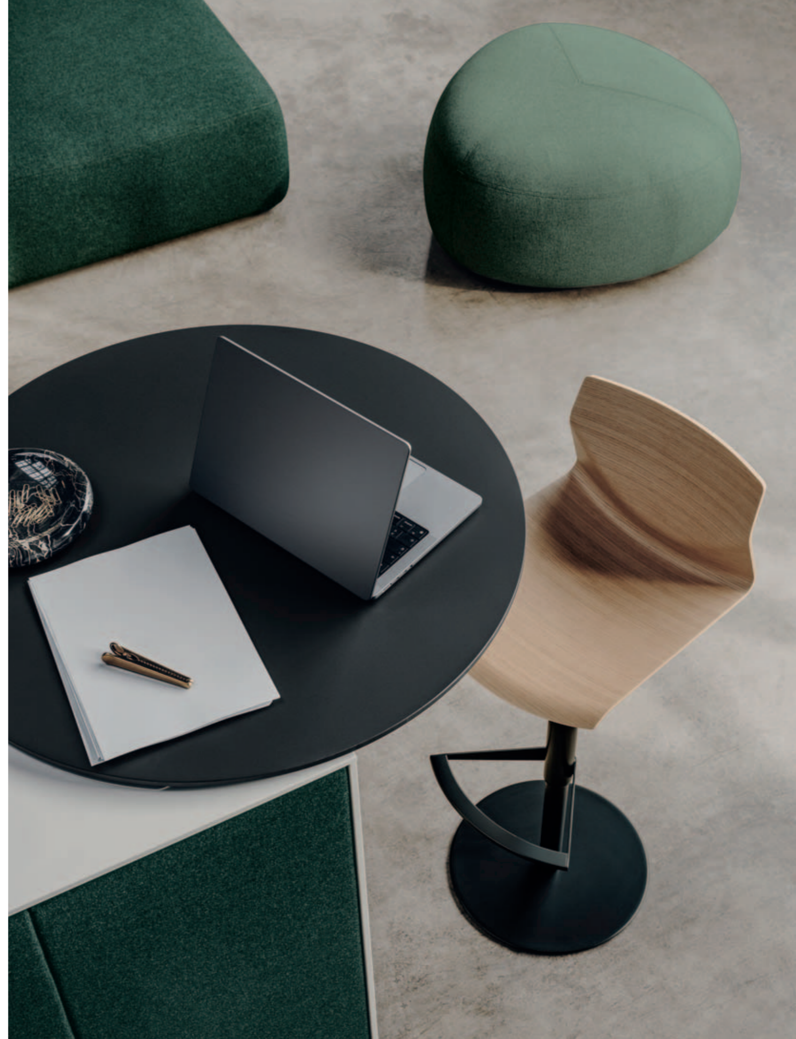
ADD SYSTEM office system, KAI stool, PLUS sofa, KIPU pouf, JEY side table

Piccoli uffici crescono. Si parte con una sedia e una scrivania. Poi se ne aggiunge un'altra e un'altra ancora, per non parlare delle cassettiere e dei contenitori... ADD SYSTEM nasce per armonizzare ogni nuovo elemento che entra in ufficio secondo un'unica filosofia di arredo. Un piano tondo alto si integra facilmente al contenitore ADD S per creare una scrivania in più. Mentre il tavolino portatile JEY consente di lavorare comodamente anche quando si è seduti sul divano PLUS.