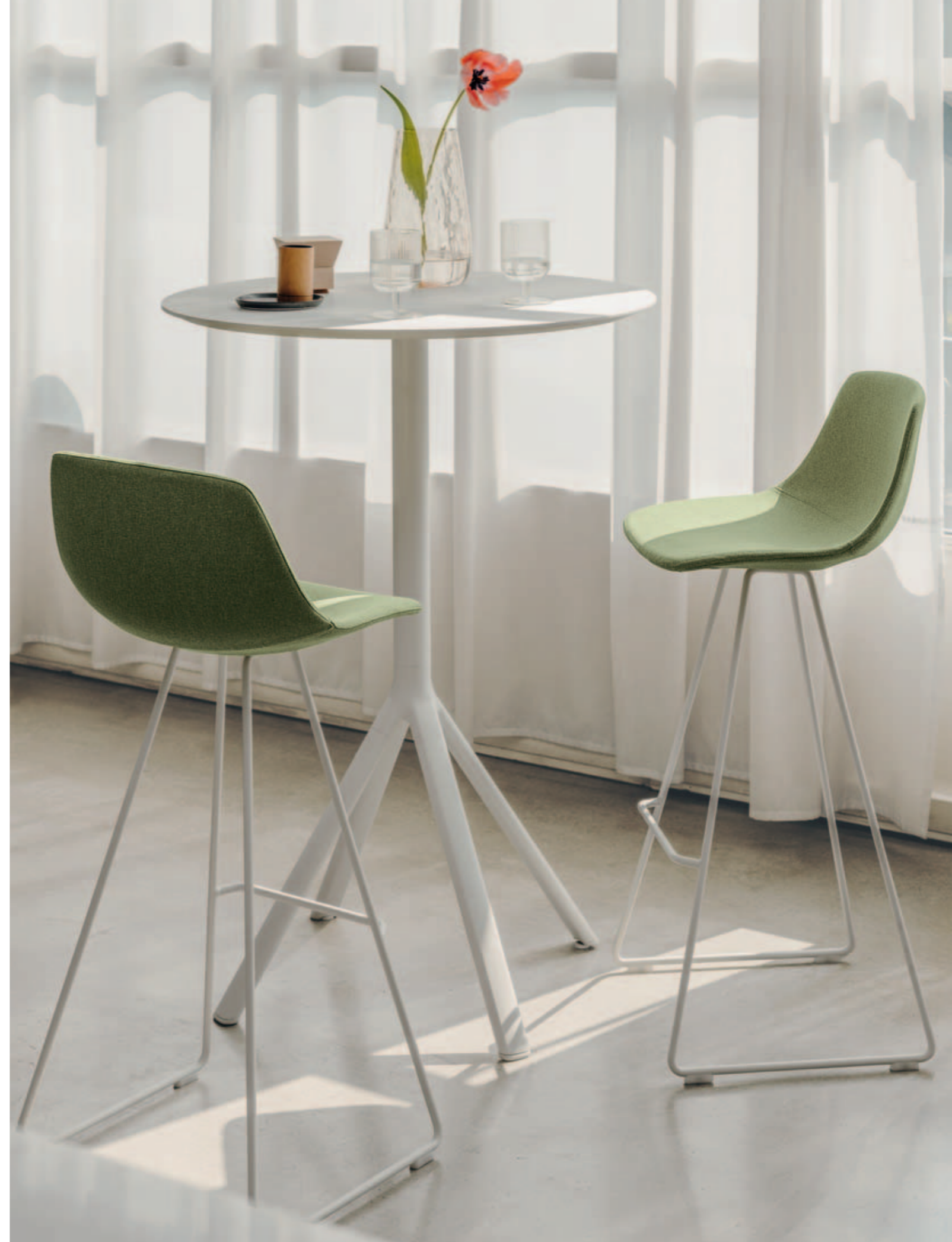
MIUNN stool, FORK table