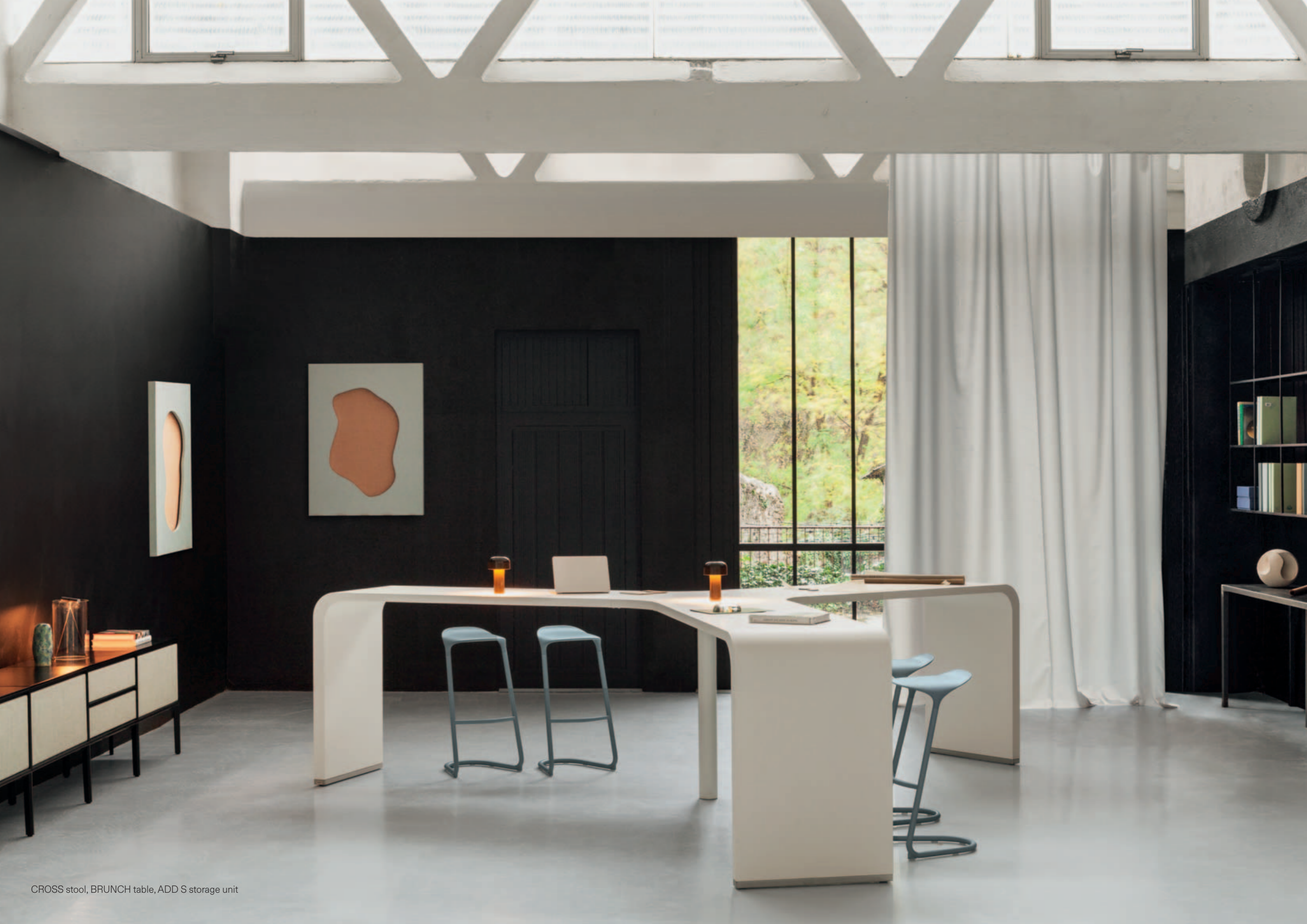
CROSS stool, BRUNCH table, ADD S storage unit