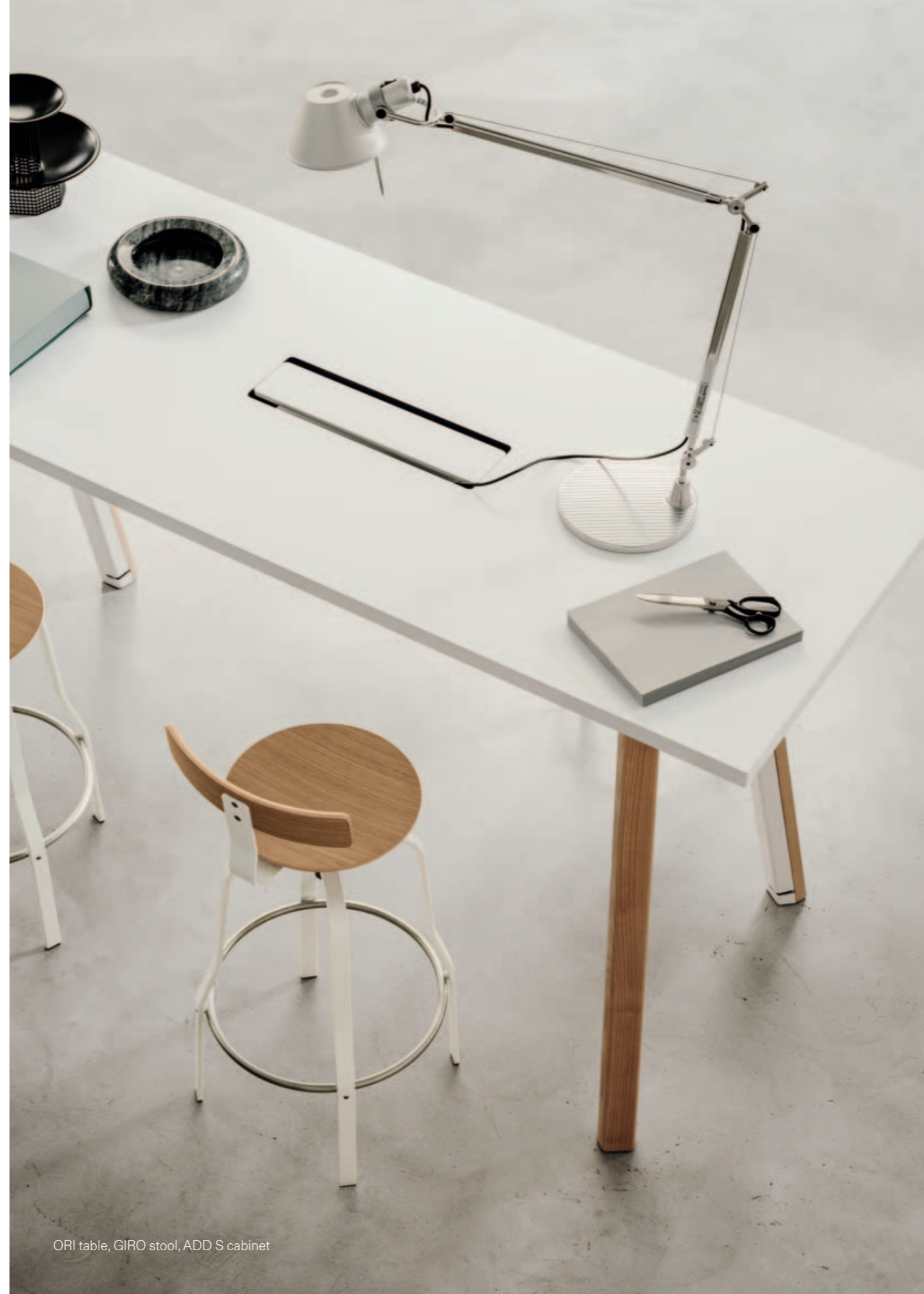
ORI table, GIRO stool, ADD S cabinet