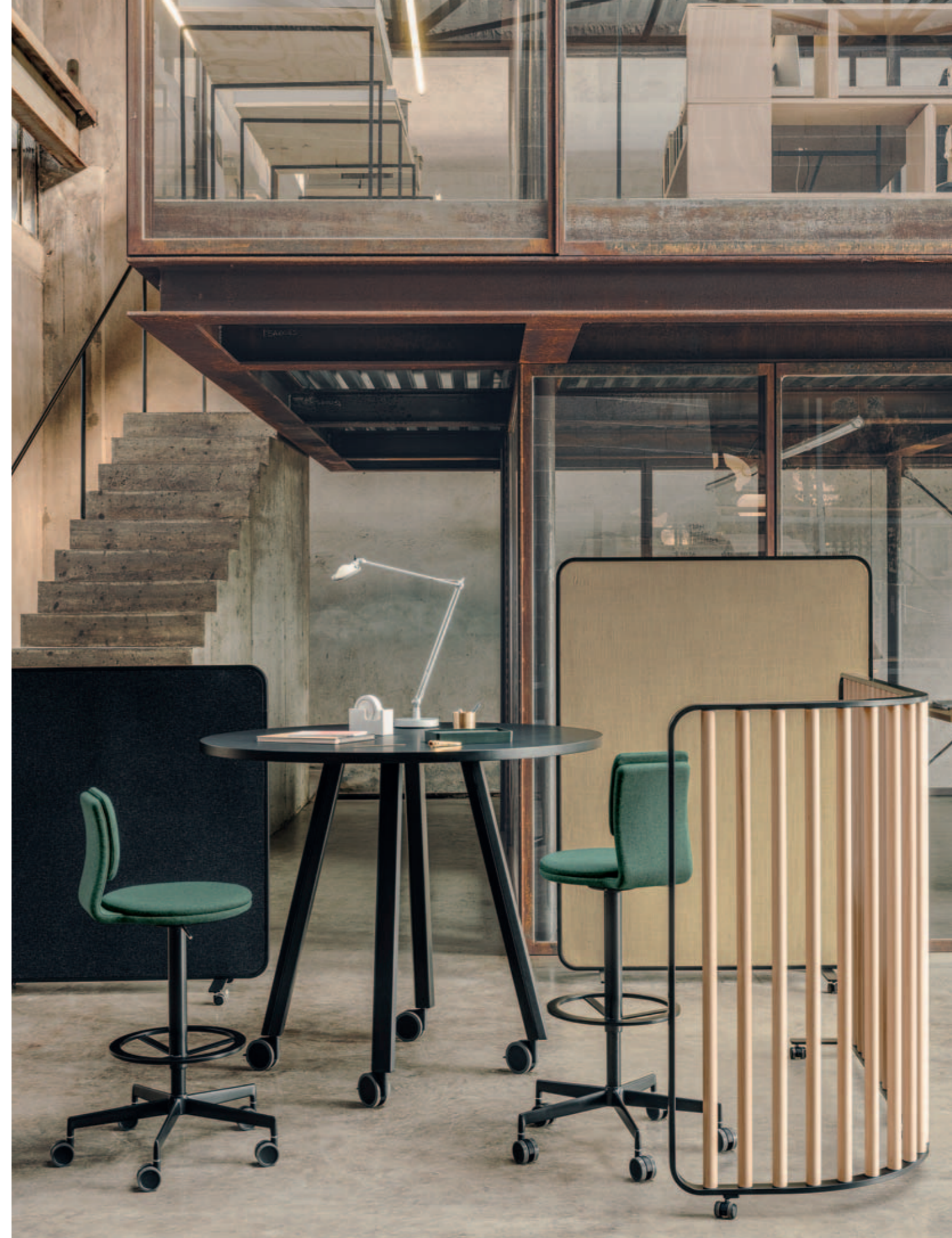
SCREEN space divider, LAB stool, ORI table