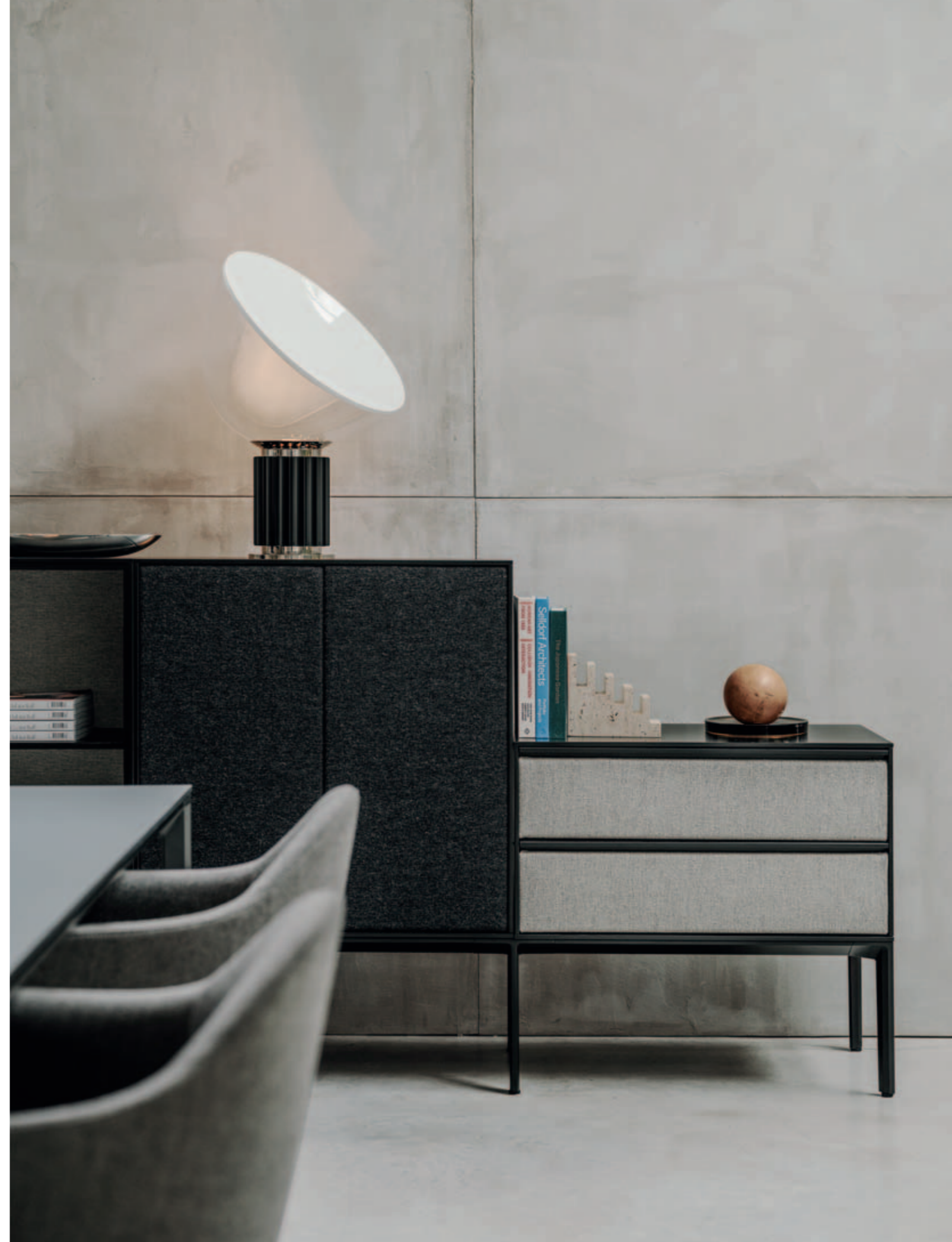
EDIT chair, ADD S storage unit, ADD T table