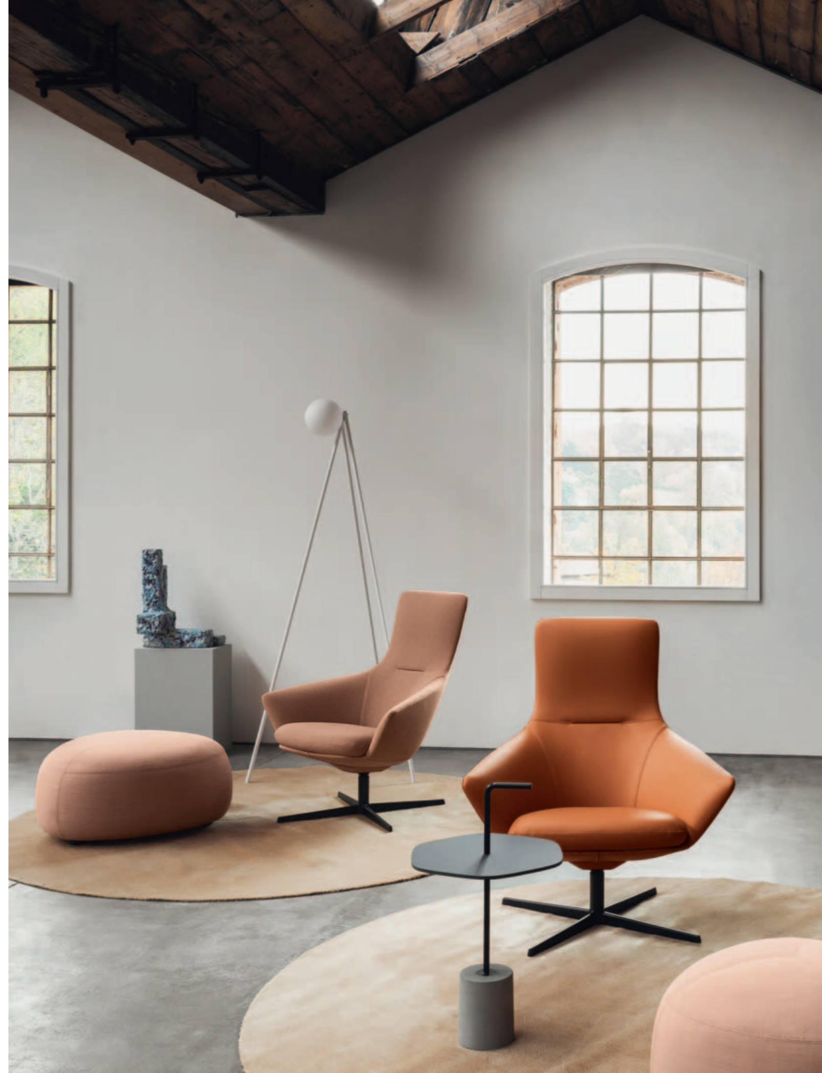
WING TIP lounge chair, KIPU pouf, JEY side table