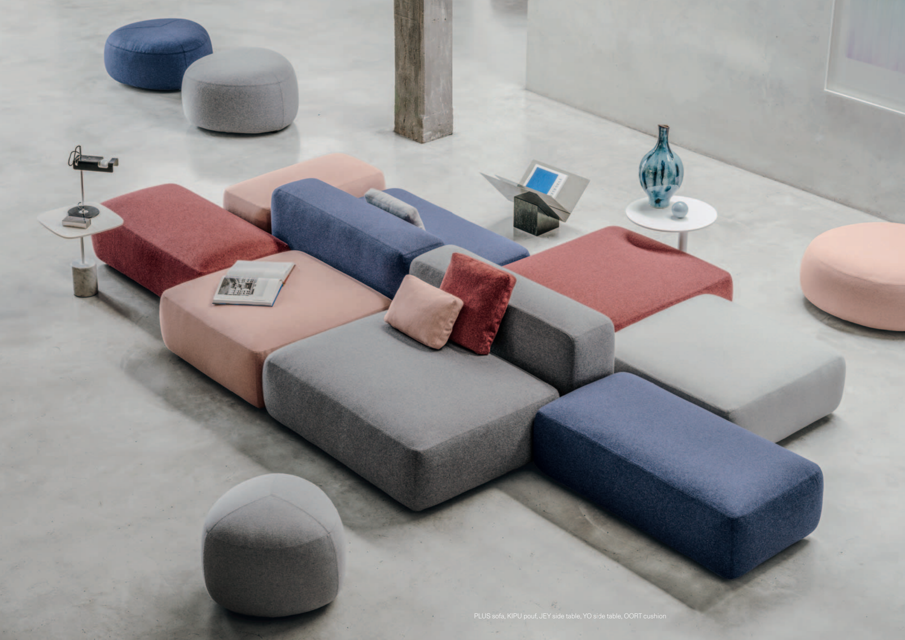
PLUS sofa, KIPU pouf, JEY side table, YO side table, OORT cushion