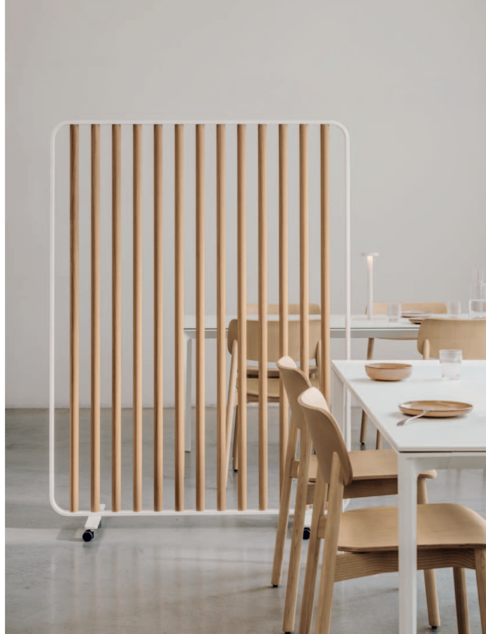
SCREEN space divider, ADD T table, OIVA chair