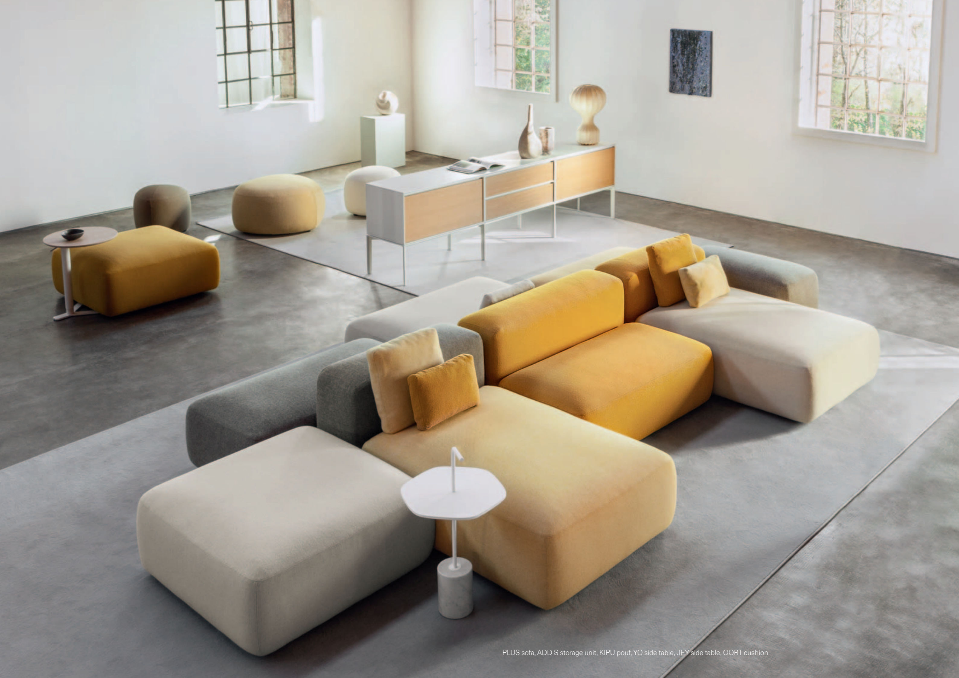
PLUS sofa, ADD S storage unit, KIPU pouf, YO side table, JEY side table, OORT cushion