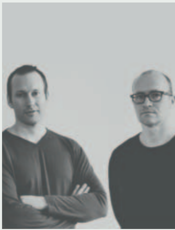
Anderssen & Voll