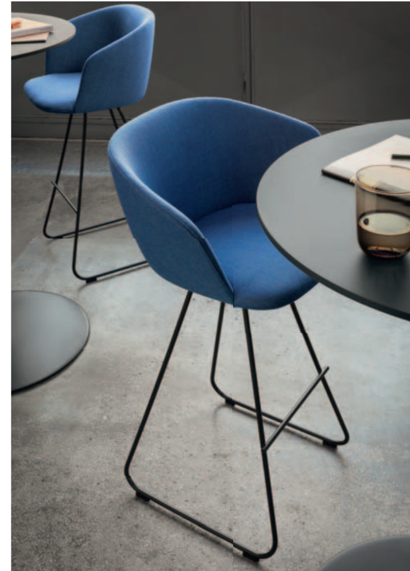
GLOVE stool, BRIO table

Diciamo la verità: quando pensiamo a uno sgabello, la parola "comfort" non è la prima che ci viene in mente. Francesco Rota ha raccolto la sfida: disegnare uno sgabello alto la cui seduta fosse accogliente come una poltroncina e che, allo stesso tempo, avesse un bel segno grafico, leggero e contemporaneo. Ha pensato a uno schienale alto che sorregge e sostiene il dorso, con un'imbottitura che avvolge tutta l'ampia seduta. La morbidezza delle linee continua nella base, dove le gambe in tondino di metallo "a slitta" donano slancio all'insieme ma non dimenticano di ospitare una comoda barretta poggia piedi. Vinta la scommessa, a questo riuscito esercizio di equilibrio non restava che trovare un nome, ed è stata la parte più facile: GLOVE, guanto. Basta sedercisi per capire il perché.