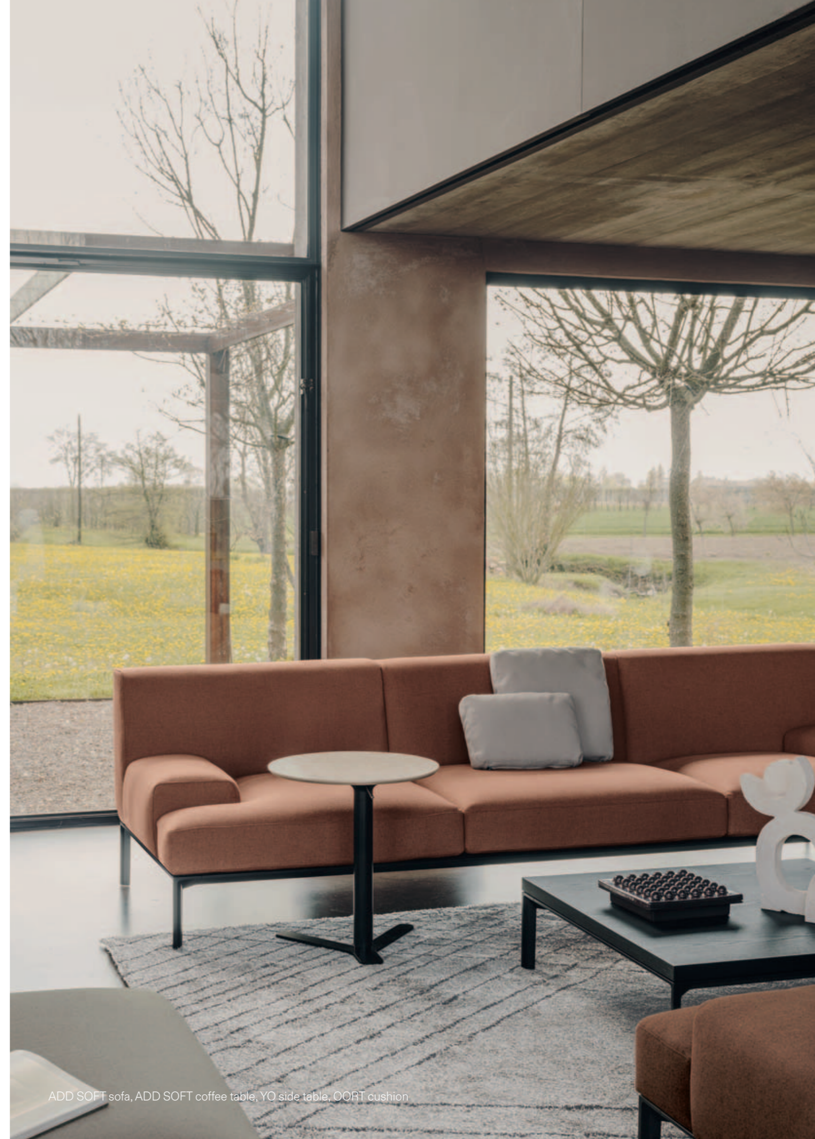
ADD SOFT sofa, ADD SOFT coffee table, YO side table, OORT cushion